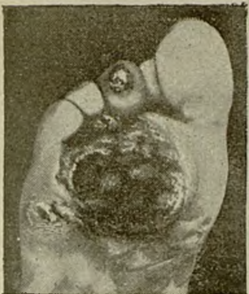
Resultados Finales de un Pie Diabético a causa del Tratamiento Conservativo