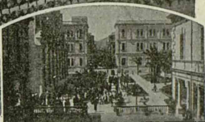
Avenida del Parque