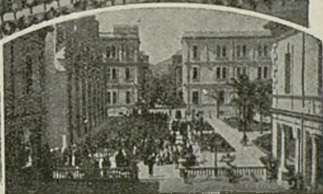
Avenida del Parque