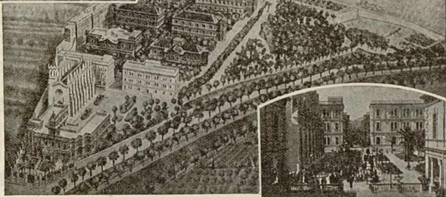
Avenida del Parque