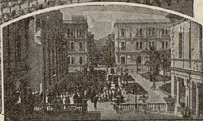
Avenida del Parque