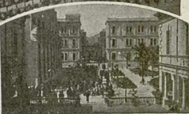
Avenida del Parque