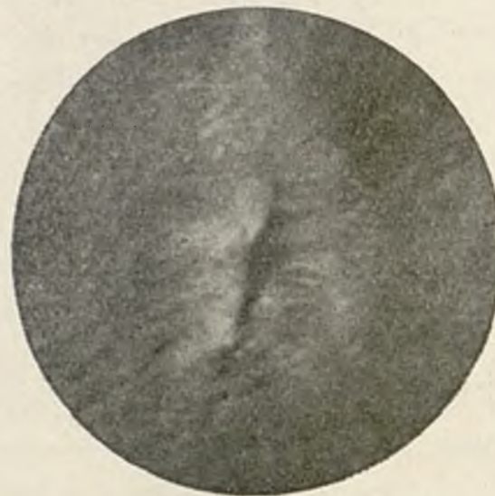
Als 8 dies de tractament