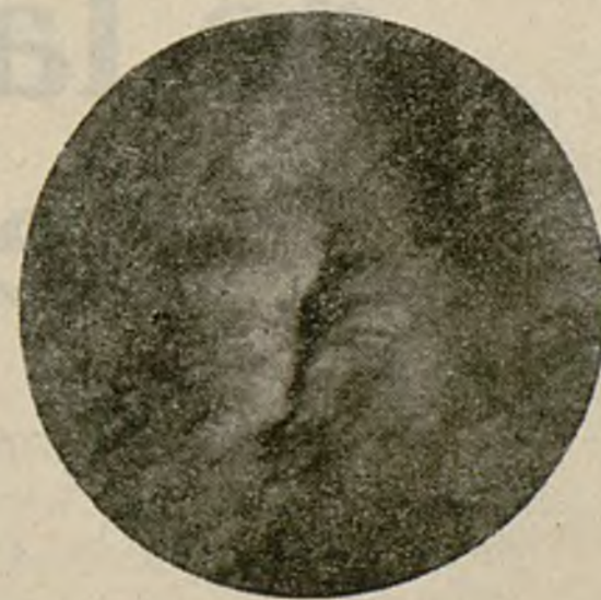
Als 15 dies de tractament

Per a mostres i literatura: J. Casalí - Pge. Domingo, 9 Telèf. 71379 - Barcelona