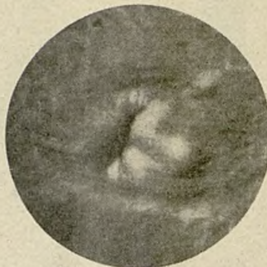
Abans del tractament