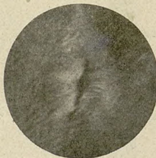
Als 15 dies de tractament