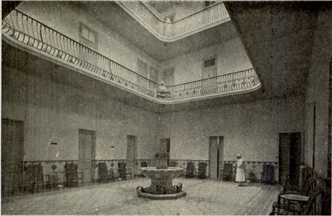
Palacio de la Mutuality. — Patio interior y galerías

lacio de la Mutuality no podemos incurrir en el egoísmo del silencio, callando las perfecciones que contiene. Por eso que al sintetizar la magnitud de esa obra y contemplar el alivio que ha proporcionado a la humanidad doliente, como una feliz