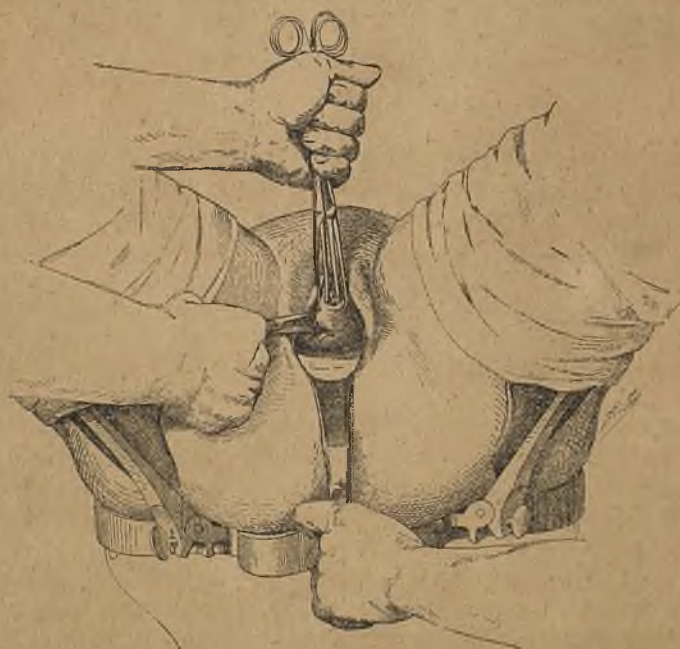
Fig. 2. — Incisió del cul-de-sac posterior de la vagina (Doyen).

V en V, s'arriba a fixar la massa pel seu diametre transversal i a