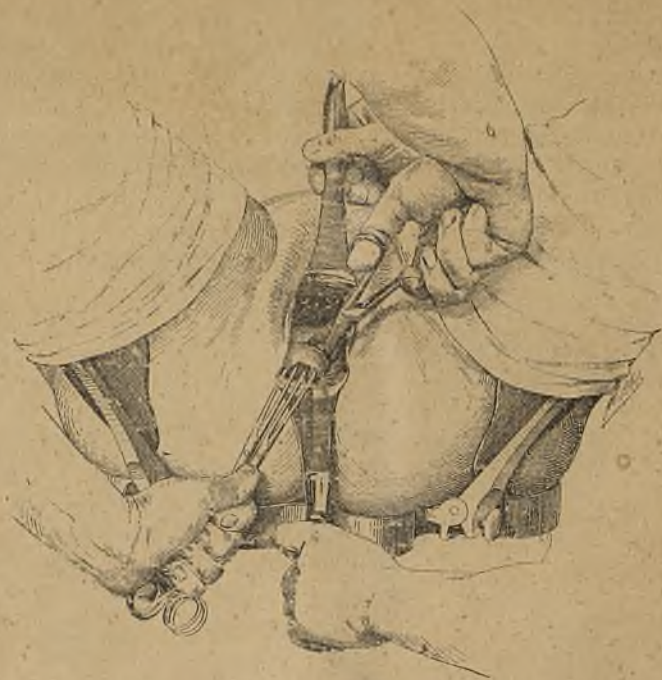
Fig. 4.—Incisió superior (Doyen).