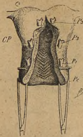
Fig. 10.— Posicions successives P_1 , P_2 , P_3 de les pinces destinades a l'extracció de l'uter en els llavis de l'hemisecció anterior.—Pc, pinces mantenint el coll.—CP, cul-de-sac peritoneal anterior.

minoses, cal incindir-les i evaquar-les; i llurs parets, primer agafades am l'index i l medius, i després entre ls morsos d'una