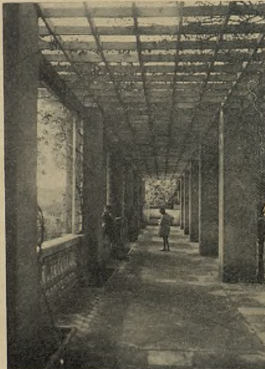
Vistes exteriors i interiors de la «Llar Infantil Lliurat Garcia» i «Llar Bancària Lòpez Raimundo»