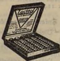
Lactéol del Dr BOUCARD Comprimidos de bacilos lácticos

El Lactéol del Dr BOUCARD (Comprimidos de bacilos lácticos) realiza una desinfección intestinal rápida Enteritis, Diarreas, Infección y autointoxicación intestinal.