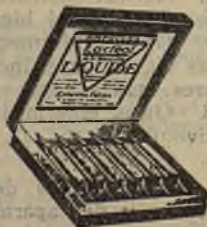
Lactéol-Líquido del Dr BOUCARD Ampollas de bacilos lácticos.

9 a 12 comprimidos al día, desleídos en un poco de agua azucarada antes de las comidas