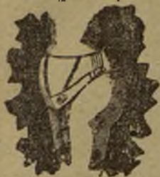
CON REAL PRIVILEGIO EXCLUSIVO

Aprobados por las Reales Academias de Medicina de Barcelona Zaragoza, Sevilla, y Valladolid. — CÉNTRICO-REGULADOR, RAMON OCLCSOR