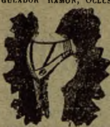
CON REAL PRIVILEGIO EXCLUSIVO

Aprobados por las Reales Academias de Medicina de Barcelona, Zaragoza, Sevilla, y Valladolid. — CÉNTRICO-REGULADOR RAMON, OCLUSOR RESTRICTIVO RAMÓN