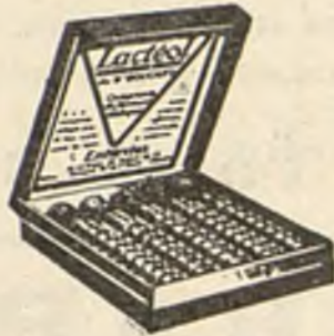
Lactéol del Dr BOUCARD Comprimidos de bacilos lácticos

El Lactéol del Dr BOUCARD (Comprimidos de bacilos lácticos) realiza una desinfección intestinal rápida. Enteritis. Diarreas. Infección y autointoxicación intestinal.