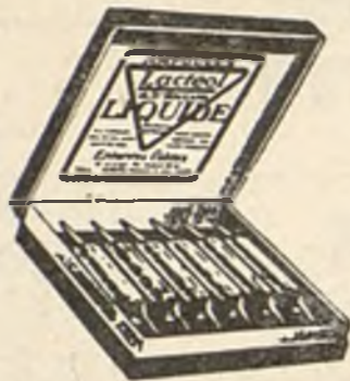
Lactéol-Líquido del Dr BOUCARD Ampollas de bacilos lácticos.

Modo de emplearlo: 9 a 12 comprimidos al día, desleídos en un poco de agua azucarada antes de las comidas