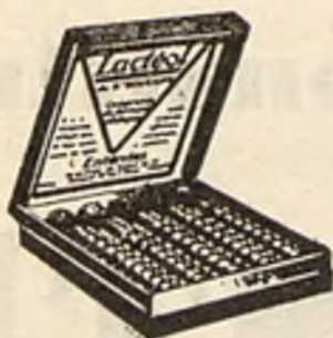
Lactéol del Dr BOUCARD Comprimidos de bacilos lácticos

El Lactéol del Dr BOUCARD (Comprimidos de bacilos lácticos) realiza una desinfección intestinal rápida. Enteritis, Diarreas, Infección y autointoxicación intestinal.