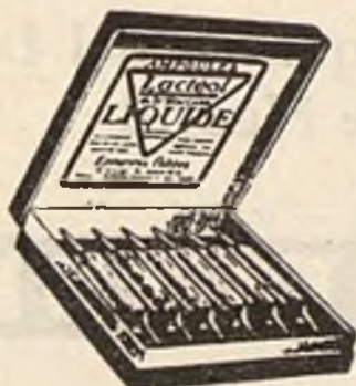
Lactéol-Líquido del Dr BOUCARD Ampollas de bacilos lácticos

9 a 12 comprimidos al día, desleídos en un poco de agua azucarada antes de las comidas