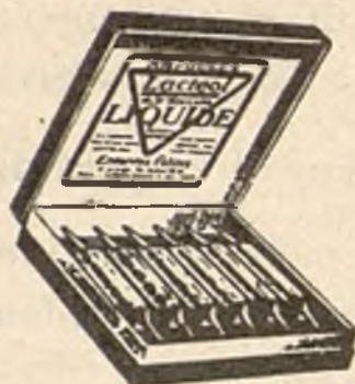
Lactéol-Líquido del Dr BOUCARD Ampollas de bacilos lácticos.

9 a 12 comprimidos al día, desleídos en un poco de agua azucarada antes de las comidas