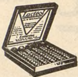
Lactéol del Dr BOUCARD Comprimidos de bacilos lácticos

El Lactéol del Dr BOUCARD (Comprimidos de bacilos lácticos) realiza una desinfección intestinal rápida. Enteritis, Diarreas, Infección y autointoxicación intestinal.