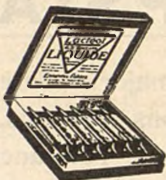
Lactéol-Líquido del Dr BOUCARD Ampollas de bacilos lácticos

9 a 12 comprimidos al día, desleídos en un poco de agua azucarada antes de las comidas