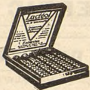
Lactéol del Dr BOUCARD Comprimidos de bacilos lácticos

El Lactéol del Dr BOUCARD (Comprimidos de bacilos lácticos) realiza una desinfección intestinal rápida. Enteritis, Diarreas, Infección y autointoxicación intestinal.