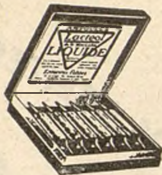
Lactéol-Líquido del Dr BOUCARD Ampollas de bacilos lácticos

Modo de emplearlo: 9 a 12 comprimidos al día, desleídos en un poco de agua azucarada antes de las comidas