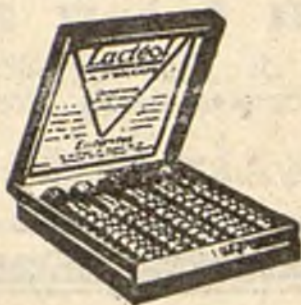
Lactéol del Dr BOUCARD Comprimidos de bacilos lácticos

El Lactéol del Dr BOUCARD (Comprimidos de bacilos lácticos) realiza una desinfección intestinal rápida. Enteritis, Diarreas, Infección y autointoxicación intestinal.