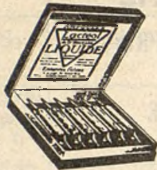
Lactéol-Líquido del Dr BOUCARD Ampollas de bacilos lácticos

9 a 12 comprimidos al día, desleídos en un poco de agua azucarada antes de las comidas