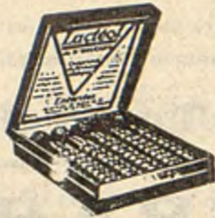
Lactéol del Dr BOUCARD Comprimidos de bacilos lácticos

El Lactéol del Dr BOUCARD (Comprimidos de bacilos lácticos) realiza una desinfección intestinal rápida. Enteritis, Diarreas, Infección y autointoxicación intestinal.