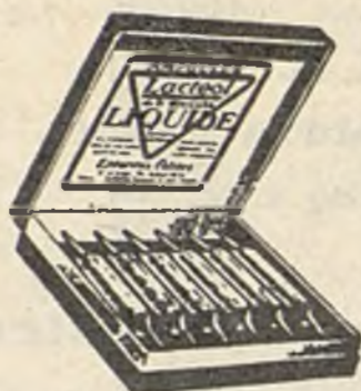
Lactéol-Líquido del Dr BOUCARD Ampollas de bacilos lácticos.

9 a 12 comprimidos al día, desleídos en un poco de agua azucarada antes de las comidas