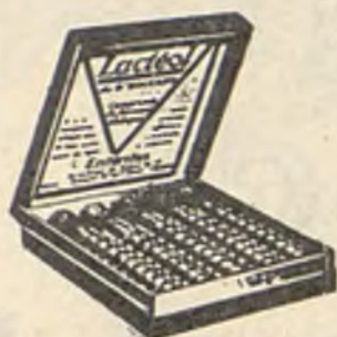
Lactéol del Dr BOUCARD Comprimidos de bacilos lácticos

El Lactéol del Dr BOUCARD (Comprimidos de bacilos lácticos) realiza una desinfección intestinal rápida. Enteritis, Diarreas, Infección y autointoxicación intestinal.