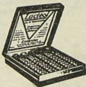
Lactéol del Dr BOUCARD Comprimidos de bacilos lácticos

El Lactéol del Dr BOUCARD (Comprimidos de bacilos lácticos) realiza una desinfección intestinal rápida. Enteritis. Diarreas. Infección y autointoxicación intestinal.