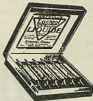
Lactéol-Líquido del Dr BOUCARD Ampollas de bacilos lácticos

9 a 12 comprimidos al día, desleídos en un poco de agua azucarada antes de las comidas