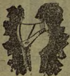
CON REAL PRIVILEGIO EXCLUSIVO

Aprobados por las Reales Academias de Medicina de Barcelona, Zaragoza, Sevilla, y Valladolid. — CÉNTRICO-REGULADOR RAMON, OCLUSOR RESTRICTIVO RAMON