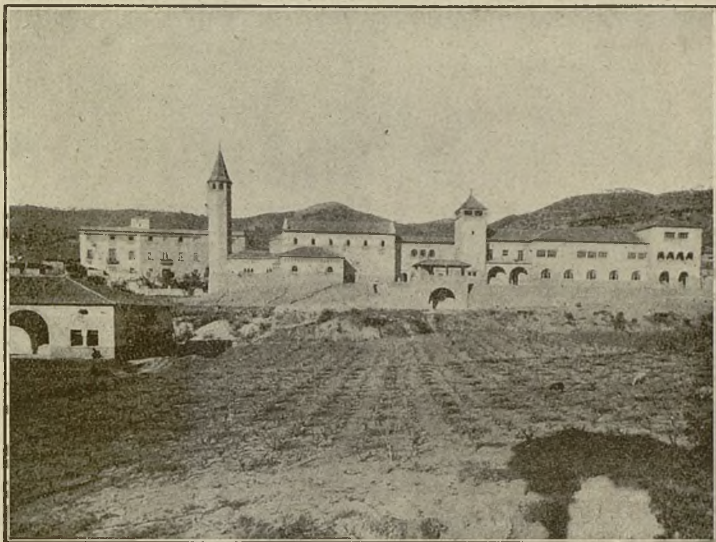
Fig. 7 — L'església, pavellons de serveis generals i l'antiga «Masia Torribera» al fons